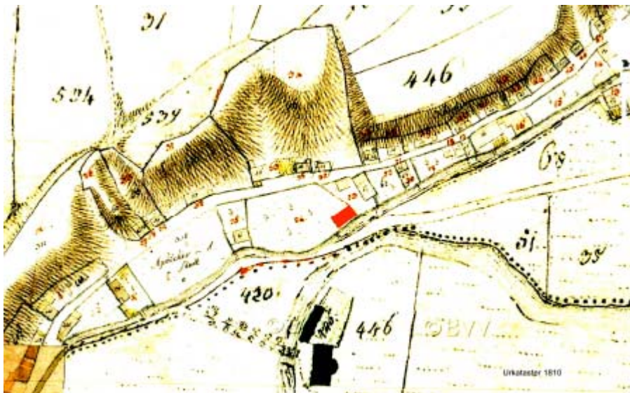
Urkataster Neustift 1810 (Auszug) (StAFS)

Im Urkataster von Neustift 1810 ist das Lederer-Gebäude in der Form eines Rechteckes (hier rot) eingetragen. Vorhanden war damals bereits auch der schmale Fußweg, der heute noch an der östlichen Giebelseite von der H Alten Poststraße verläuft.